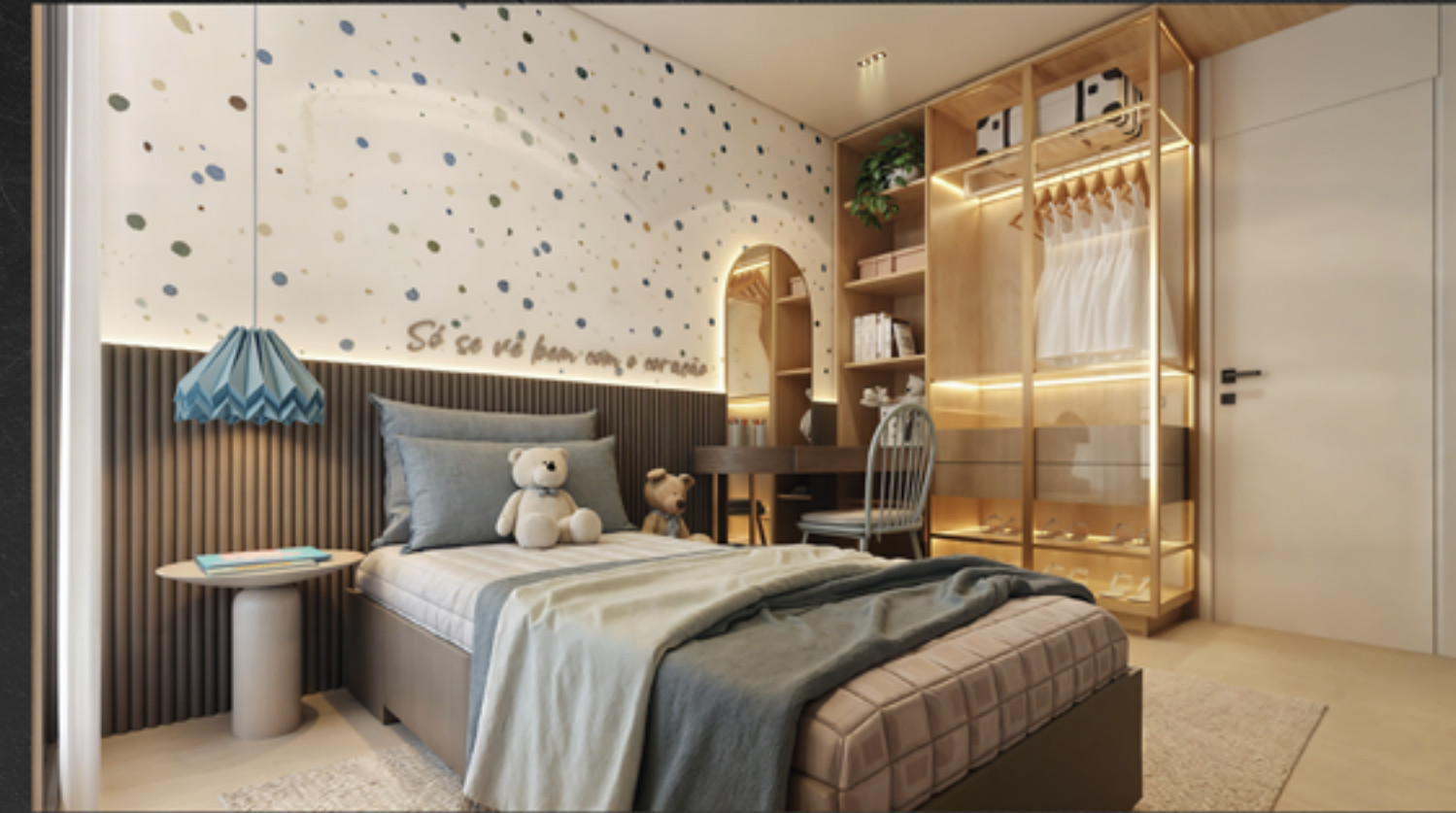
Coluna 3 Quarto Filha