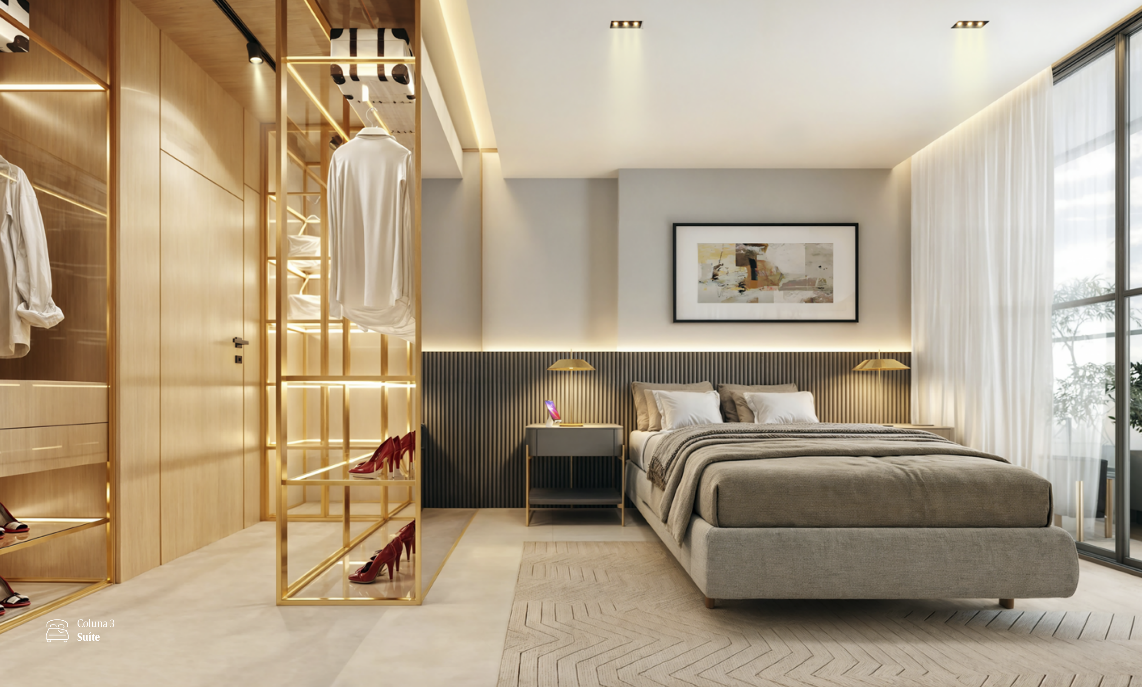
Coluna 3 Suíte