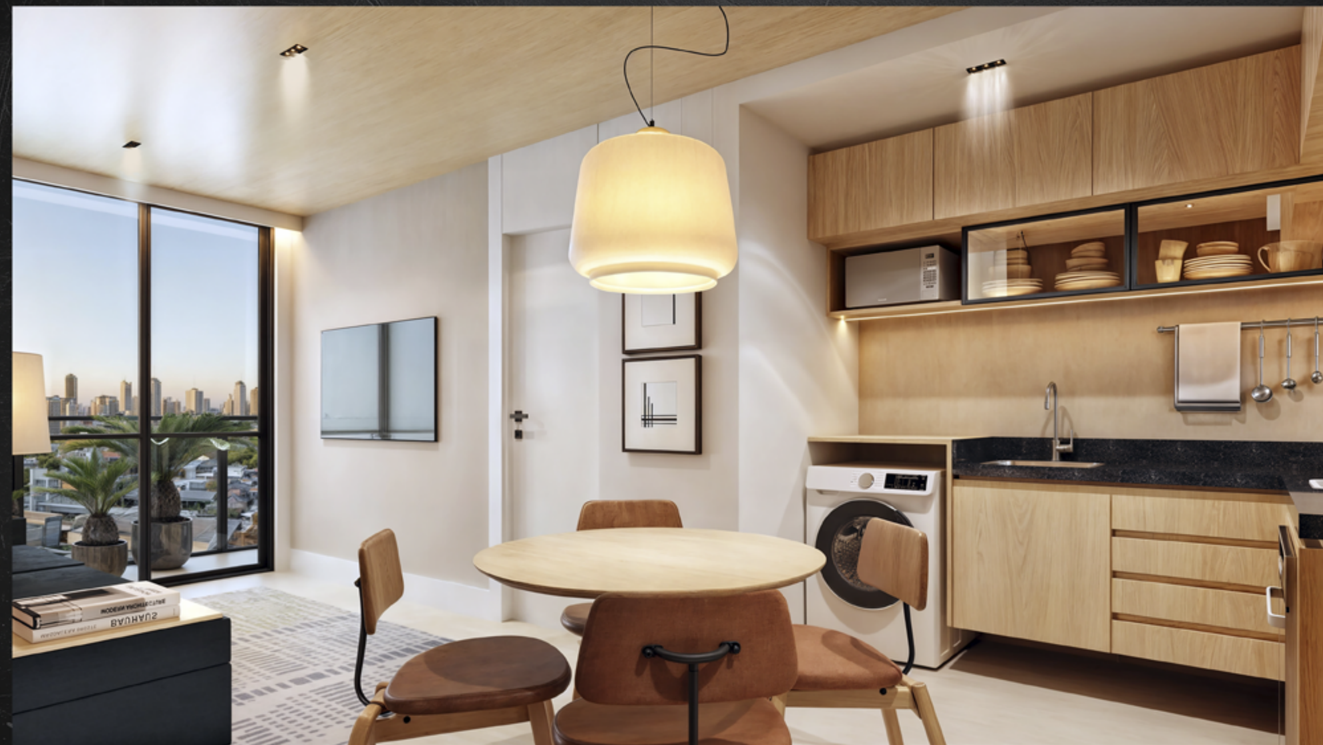
Coluna 2 Sala de Estar