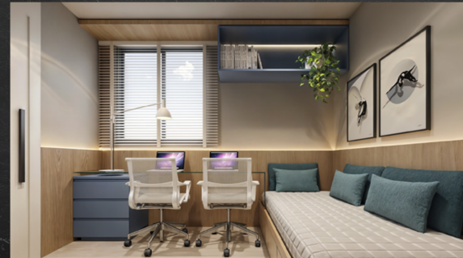
Coluna 3 Quarto Filho